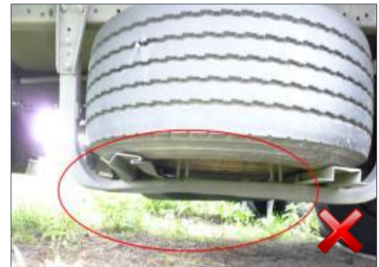
Rodzaj obciążenia: odnowienie (100%)