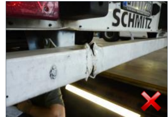
Rodzaj obciążenia: odnowienie (100%)