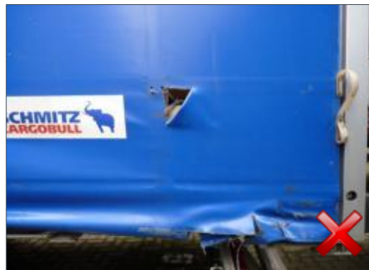
Rodzaj obciążenia: naprawa (proporcjonalnie do czasu trwania)