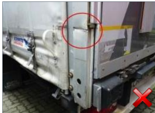
Rodzaj obciążenia: naprawa (proporcjonalnie do czasu trwania)