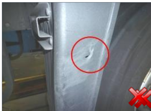
Rodzaj obciążenia: odnowienie (proporcjonalnie) funkcjonalność jest zapewniona