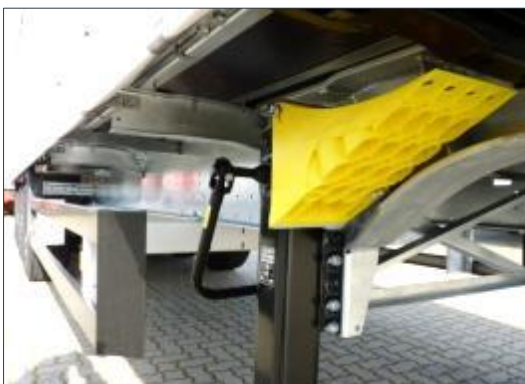
Kliny zabezpieczające pod koło

Osprzęt taki, jak: koła zapasowe, drążek do dachu składanego typu Edscha, kliny zabezpieczające pod koło, dokumenty pojazdu (jak dowód rejestracyjny, teczka pokładowa pojazdu itd.)