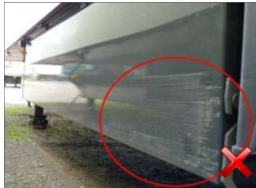
Rodzaj obciążenia: naprawa (proporcjonalnie do czasu trwania)