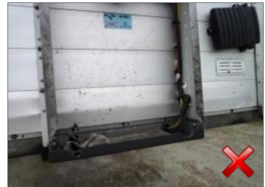
Rodzaj obciążenia: odnowienie wymiana części (100%)