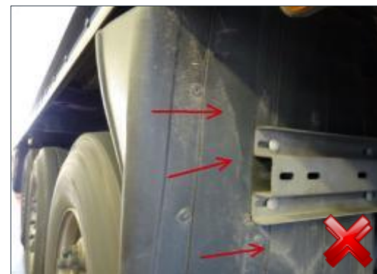
Rodzaj obciążenia: odnowienie (100%)