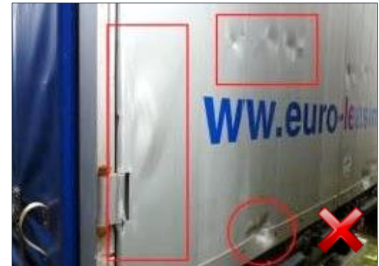
Rodzaj obciążenia: odnowienie (100%)