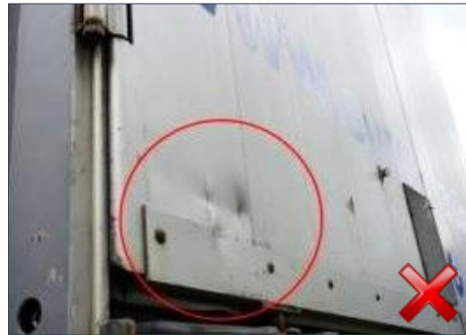
Rodzaj obciążenia: naprawa (proporcjonalnie do czasu trwania)