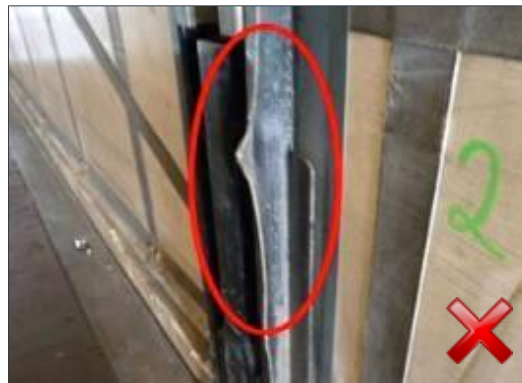
Rodzaj obciążenia: naprawa (proporcjonalnie do czasu trwania)