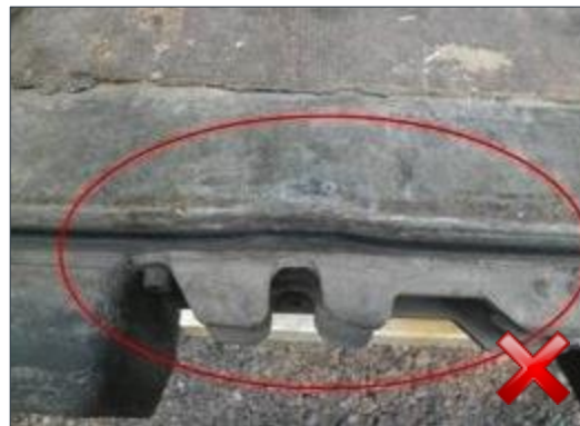
Rodzaj obciążenia: naprawa (proporcjonalnie do czasu trwania)