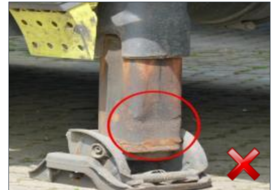
Rodzaj obciążenia: odnowienie (100%)