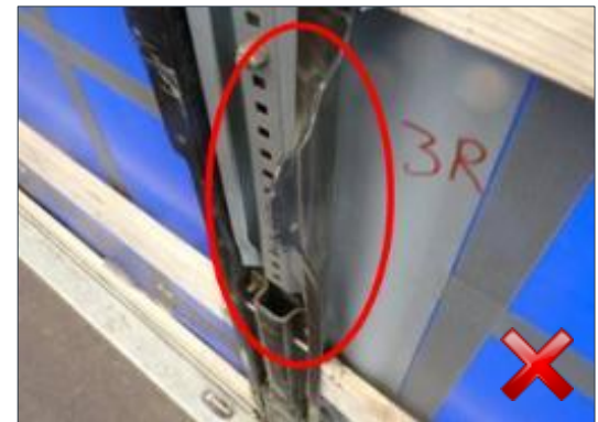
Rodzaj obciążenia: odnowienie (100%)