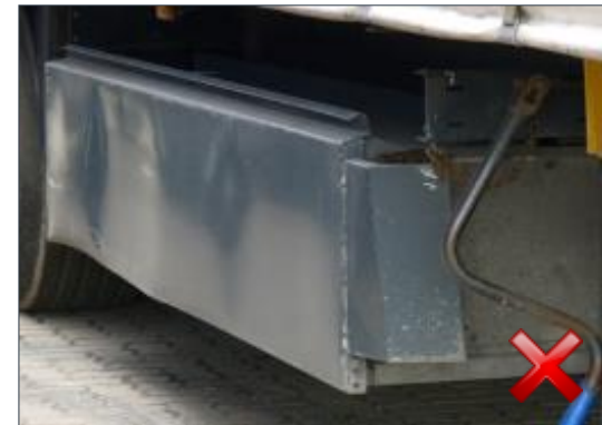
Rodzaj obciążenia: odnowienie (100%)