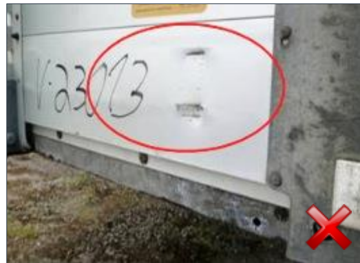
Rodzaj obciążenia: naprawa (proporcjonalnie do czasu trwania)