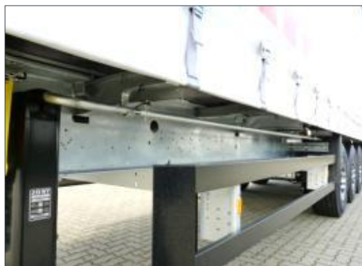
Drążek do dachu składanego typu Edscha