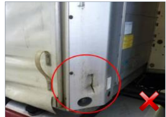
Rodzaj obciążenia: odnowienie (100%)