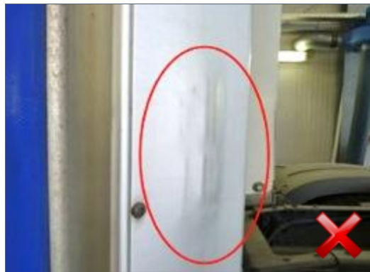
Rodzaj obciążenia: naprawa (proporcjonalnie do czasu trwania)