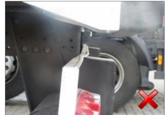
Rodzaj obciążenia: odnowienie (100%)