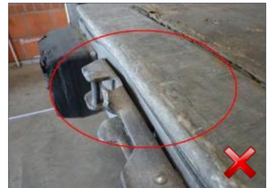
Rodzaj obciążenia: naprawa (proporcjonalnie do czasu trwania)