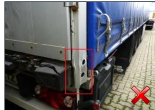
Rodzaj obciążenia: odnowienie (100%)