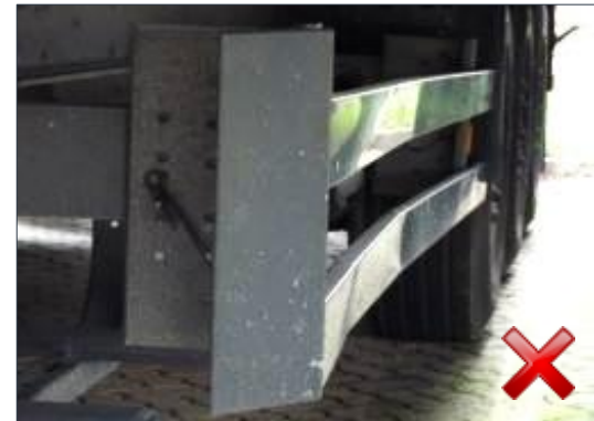
Rodzaj obciążenia: odnowienie (100%)