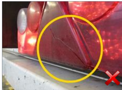
Rodzaj obciążenia: odnowienie wymiana części (szkło lampy tylnej) (100%)