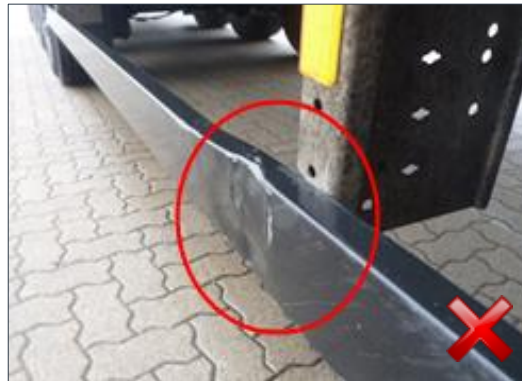
Rodzaj obciążenia: odnowienie wymiana części (100%)