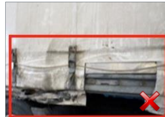
Rodzaj obciążenia: odnowienie wymiana części (100%)