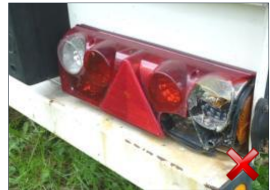
Rodzaj obciążenia: odnowienie (100%)