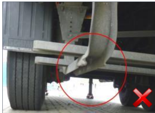
Rodzaj obciążenia: odnowienie wymiana części (100%)