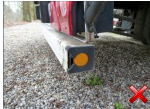
Rodzaj obciążenia: naprawa (proporcjonalnie do czasu trwania)