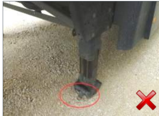
Rodzaj obciążenia: odnowienie wymiana części (100%)